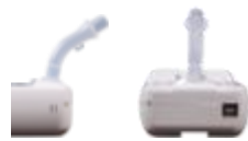
Figura 2 – Boquilla