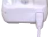
Figura 1 – Cable de Energía